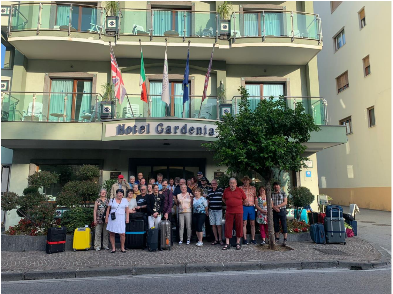
Sorrennon matkalaisia kotimatalle lähdössä 24.10.2022. Alla Pompein katukuva ja Amalfin rannikkoa